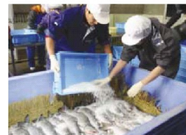
サケ・マスの加工。網走は水産業が盛んです。