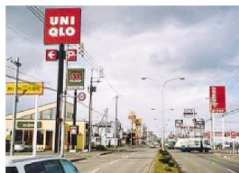
大型店が立ち並ぶ3・3・3大通

また、住宅地が郊外に広がるにつれて、市の中心部と郊外の住宅地を結ぶ道路に面して、大型スーパーや衣料品店、ホームセンターなどがショッピングゾーンを形成しています。日常の買い物には不便を感じる事がありません。