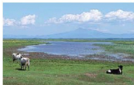
ラムサール条約の登録湿地・濁瀧湖畔