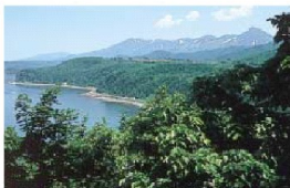
世界自然遺産・知床までは車で80分